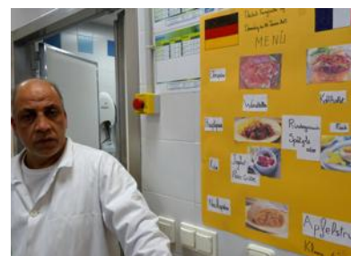
■ Lire le menu n'a pas été facile pour tous les collégiens.

Jeudi, c'était la journée franco-allemande, proposée par les enseignants de la langue et leurs élèves. La journée a été consacrée à l'amitié qui unit les deux pays, mais pas seulement... Les cuisiniers et cuisinières du restaurant scolaire ont proposé un repas totalement allemand à tous les collégiens qui ont été surpris par le menu mais l'ont trouvé à leur goût. Seule l'annulation de leur entretien avec les journalistes d'Euronews a gâché le plaisir des collégiens. Le plan Vigipirate, mis en place, ne leur a pas permis de