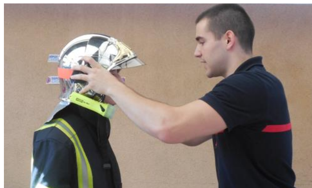
■ Les nouvelles recrues ne seront pas tout de suite opérationnelles.

Évidemment, ces nouvelles recrues ne seront pas de suite opérationnelles. Pour ces nouveaux arrivants, les formations vont se succéder : une quarantaine d'heures dans un premier temps, « soit en moyenne six semaines pour découvrir la profession et participer aux interventions comme observateur », précise le chef de centre. Viendront ensuite quatre semaines de formation au secours à la personne et autant à la formation incendie. « Une formation assez souple, annonce le capitaine. Certains vont la faire en six mois, d'autres en un an et demi, en fonction de leur activité professionnelle. En tout, ils ont trois ans pour la valider. » S'il a été conséquent en ce premier mois de l'année, le recrutement n'en reste pas moins très strict. Car même si l'on peut postuler dès l'âge de 16 ans, la visite médicale d'entrée recèle des tests de cardio, notamment, et contrôlés par le service