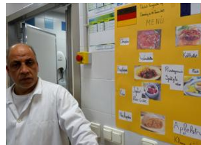
■ Lire le menu n'a pas été facile pour tous les collégiens.

Jeudi, c'était la journée franco-allemande, proposée par les enseignants de la langue et leurs élèves. La journée a été consacrée à l'amitié qui unit les deux pays, mais pas seulement... Les cuisiniers et cuisinières du restaurant scolaire ont proposé un repas totalement allemand à tous les collégiens qui ont été surpris par le menu mais l'ont trouvé à leur goût. Seule l'annulation de leur entretien avec les journalistes d'Euronews a gâché le plaisir des collégiens. Le plan Vigipirate, mis en place, ne leur a pas permis de