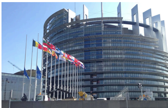
Parlement européen à Strasbourg (Alsace, Est de la France)

Avec la visite du Parlement européen, et la balade autour de cette institution, il a été plus facile de comprendre son rôle et ses ambitions. Il a été plus aisé de saisir combien l'architecture du Parlement européen reflète bien les valeurs de liberté, d'égalité et d'acceptation de la diversité qui ont cours lors de tous les débats entre eurodéputés.